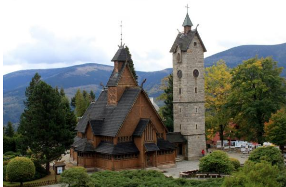
na zdjęciu świątynia Wang w Karpaczu